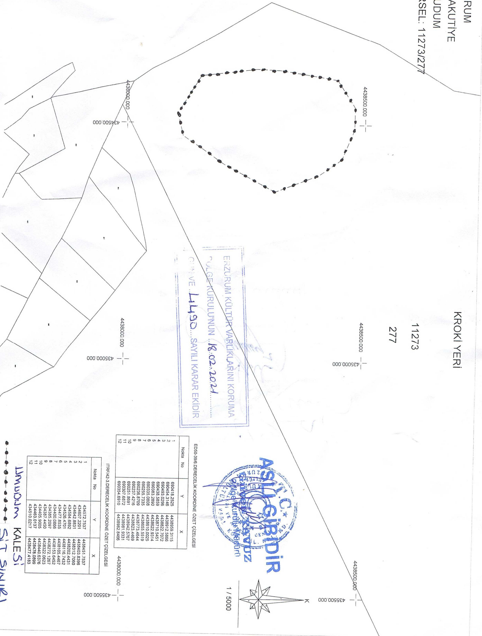
ED50-396/DERECELIK KOORDİNE ÖZET ÇİZELGESİ