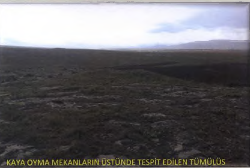
KAYA OYMA MEKANLARIN ÜSTÜNDE TESPİT EDİLEN TÜMÜLÜS