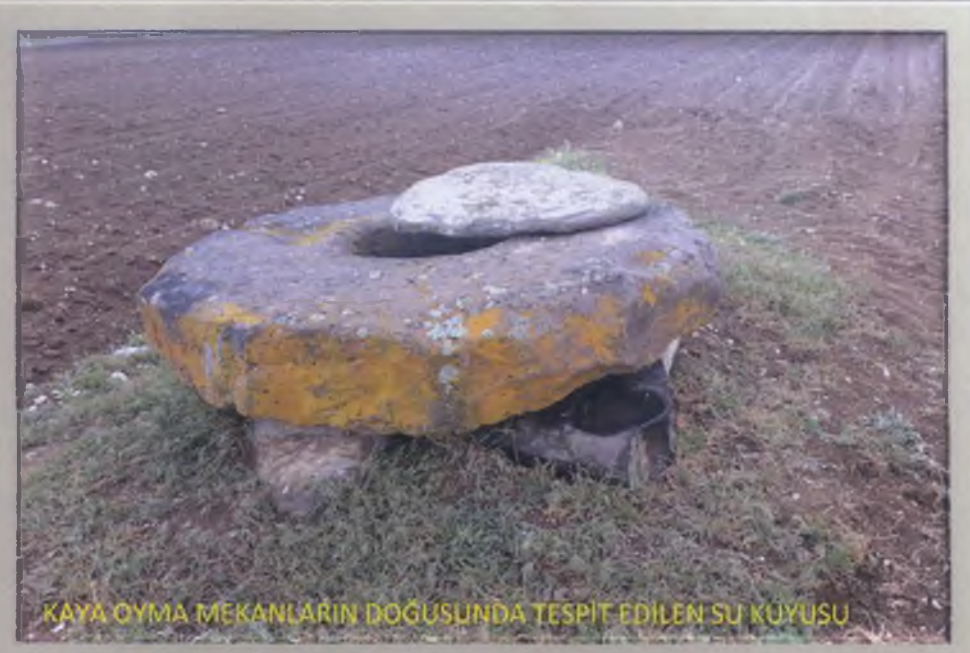
KAYA OYMA MEKANLARIN DOĞUSUNDA TESPİT EDİLEN SU KUYUSU