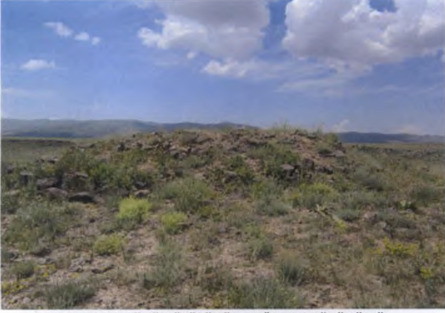
ÇUKURLAR MEVKİİ TÜMÜLÜSÜNÜN DOĞUDAN GÖRÜNÜMÜ