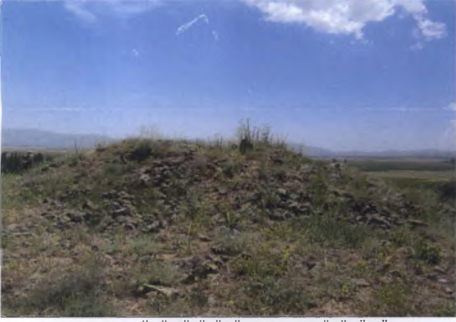
ÇUKURLAR MEVKİİ TÜMÜLÜSÜNÜN BATIDAN GÖRÜNÜMÜ