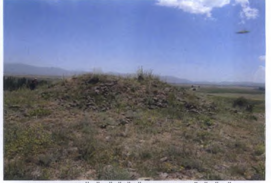
ÇUKURLAR MEVKİİ TÜMÜLÜSÜNÜN KUZeyDEN GÖRÜNÜMÜ