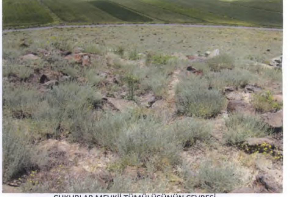
ÇUKURLAR MEVKİİ TÜMÜLÜSÜNÜN ÇEVRESİ