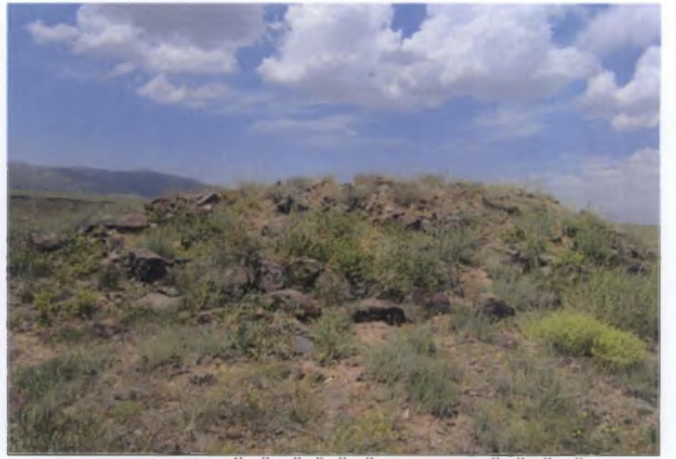
ÇUKURLAR MEVKİİ TÜMÜLÜSÜNÜN BATIDAN GÖRÜNÜMÜ