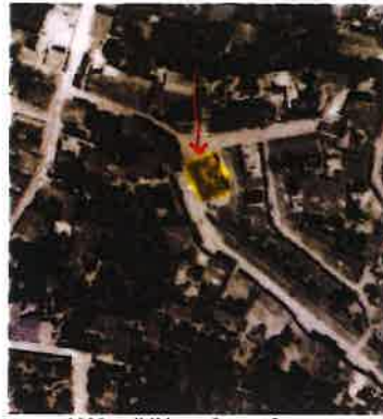
1939 tarihli hava fotoğrafı