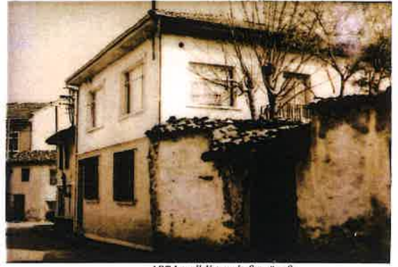
1974 tarihli tespit fotoğrafı

GÖZLEMLER: Taşınmaz, 12/05/1938 tarihinde özel mülkiyete geçmiş, Mescid yıkılarak 1950'lerde mevcut konut yapıları inşa edilmiştir.