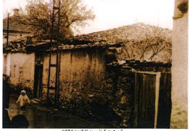
1974 tarihli tespit fotoğrafı

GÖZLEMLER: Taşınmaz, 12/10/1938 tarihinde özel mülkiyete geçmiş, Mescid yıkılarak 1950'lerde mevcut konut yapısı inşa edilmiştir.