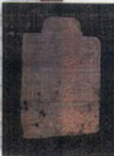
Marmar ve sağırlar Kıyapın Ağı Kavama Patlası