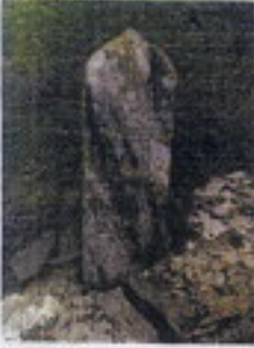
İpeği Çelebi Kavama Ağzında Kavama'da Saklıdır Sana 1000 Mikad 1000