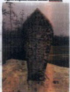
Marmar ve sağırlar Patlası Mırah Saklıdır Patlası Sana 1210 Mikad 1800