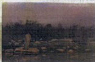
Marmar İpeği Mahallesi Çapın Dışıkta ve Pehlil Eski Türbe Yarı Kavama İpeği Çeli Mırah Yeni Kavama'da Kavama Mırah Sırtları