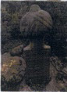
Marmar ve sağırlar Ahi Yayı Kavama Patlası Sana 1200-0 Mikad 1777-78