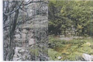
Cenevizdere Su Kemerı Kalıntıları

Roma Su Yolu Galerisinin açığa çıkan kısımları