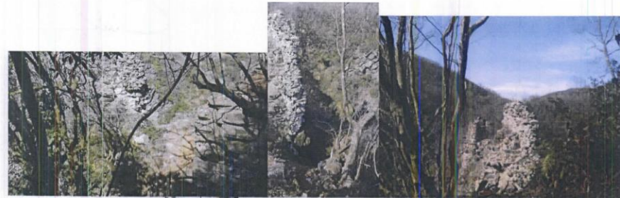
Ballıgerme Su Kemerı