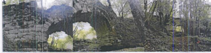
Elmalıdere Su Kemerı