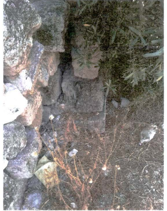
Bitişik parsellerde dağınık kullanılmış mimari malzeme