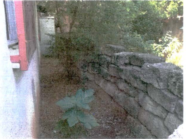
Bitişik parsellerde dağınık kullanılmış mimari malzeme